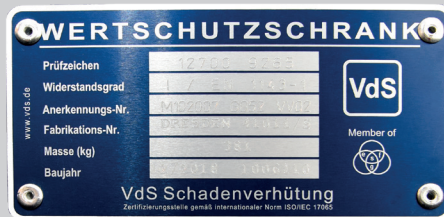
Marke der Zertifizierungsstelle VdS